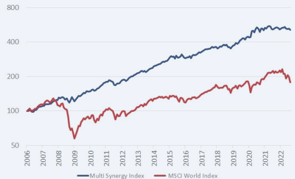
Chart: Multi Synergy Index* vs. MSCI World Index